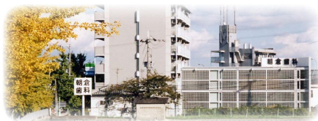
医療法人あさくら会朝倉歯科医院 春日丘本院